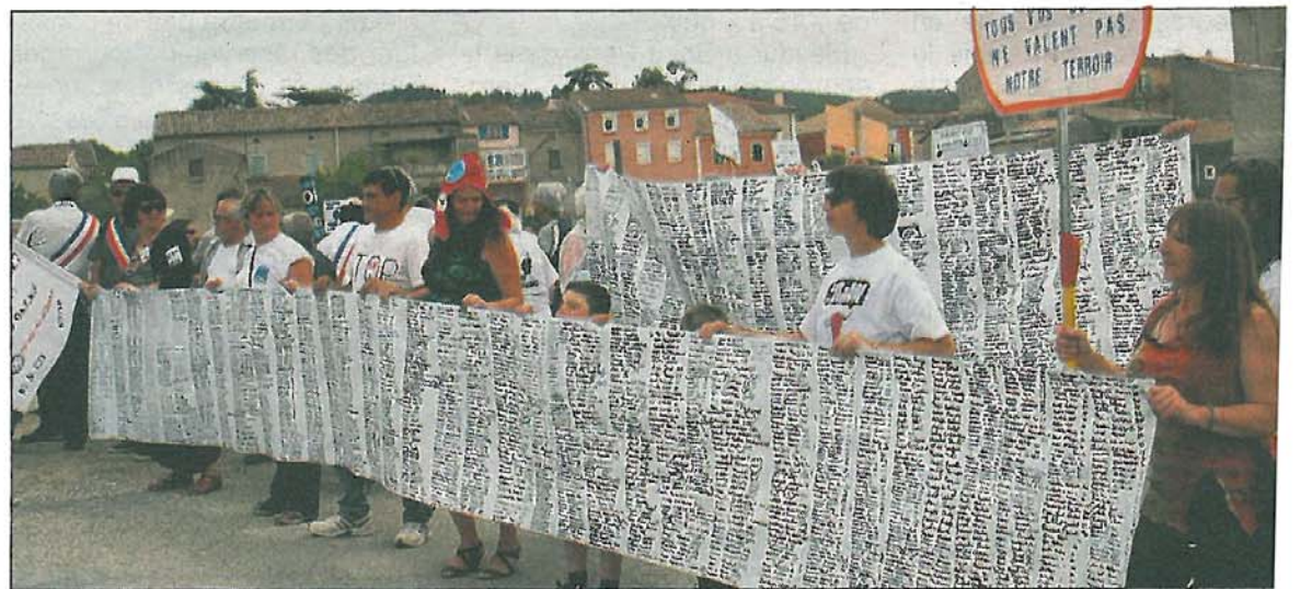
La banderole du Tour de France contre le gaz de schiste a recueilli 900 signatures à Villeneuve-de-Berg