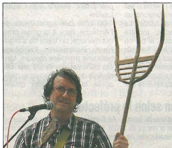
La manière ardéchoise pour accueillir les prospecteurs...