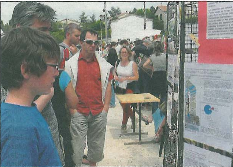
Un peu d'information sur la méthode d'extraction.