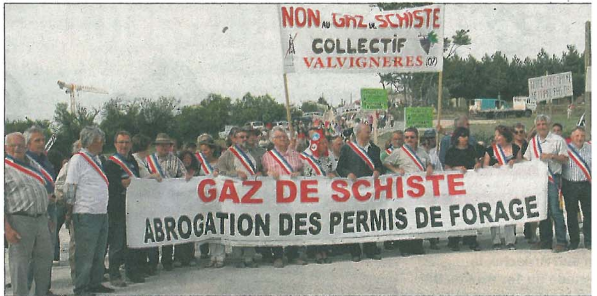
Les élus étaient très nombreux à participer à cette manifestation.