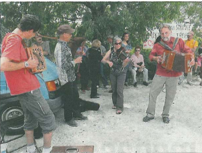
Et en musique s'il vous plaît !