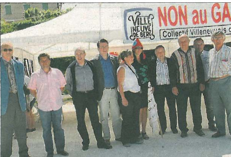
Le député Jean-Claude Flory a apporté son soutien à cette manifestation.