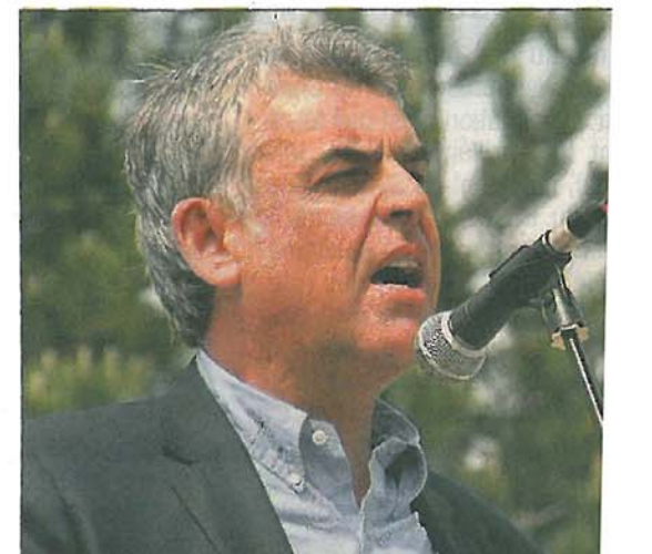
Le député a dit qu'il ne voterait pas le texte contre le gaz de schiste en l'état.