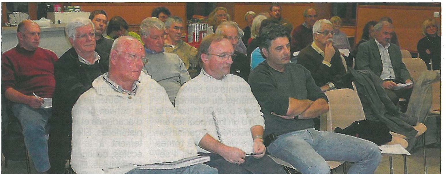
Les élus tiennent à mettre en évidence les effets potentiellement néfastes sur le territoire que comporte ce projet.

espaces naturels du Parc Naturel régional des Monts d'Ardèche, précise le vœu des élus communautaires.