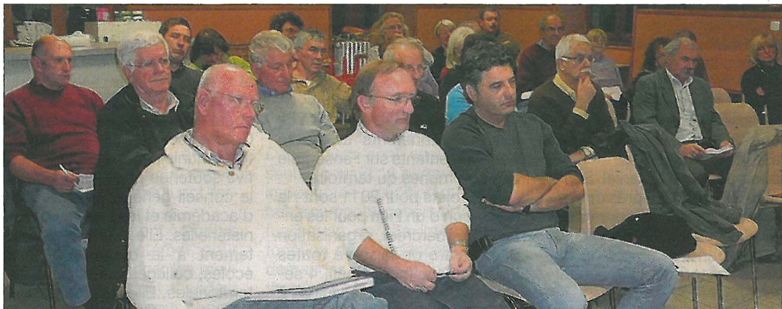
Les élus tiennent à mettre en évidence les effets potentiellement néfastes sur le territoire que comporte ce projet.

espaces naturels du Parc Naturel régional des Monts d'Ardèche, précise le vœu des élus communautaires.